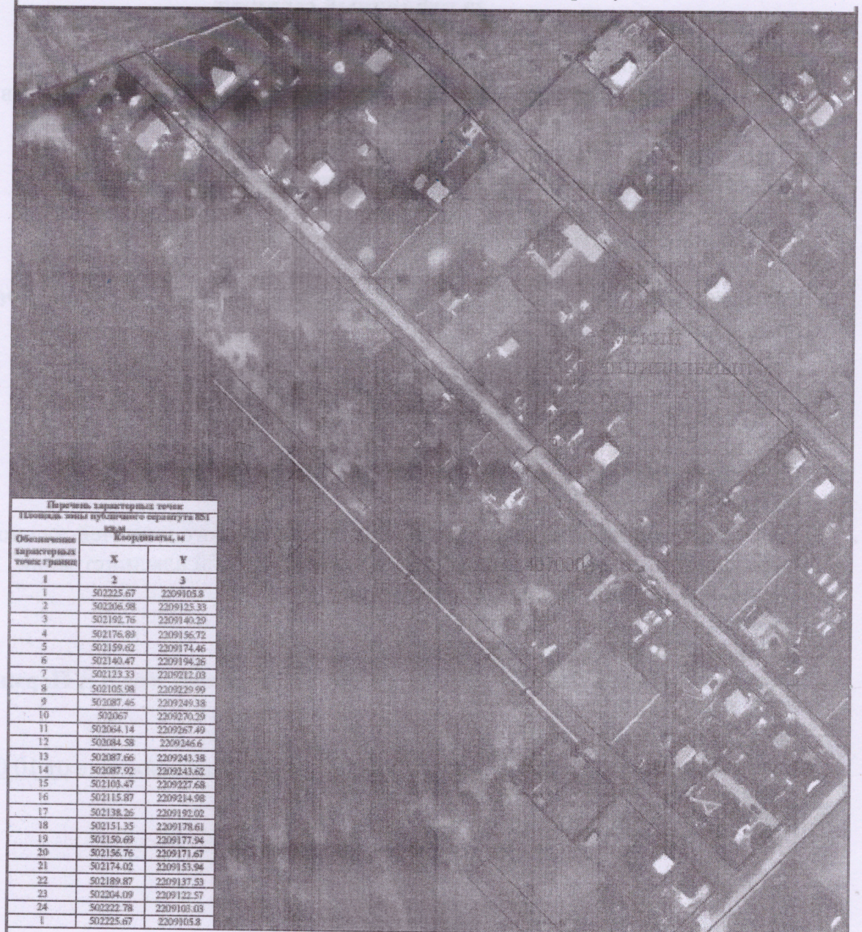
СХЕМА РАСПОЛОЖЕНИЯ ГРАНИЦ ПУБЛИЧНОГО СЕРВИТУТА Эксплуатации объекта электросетевого хозяйства ВЛ-0,4кВ ф.3 сущ.оп.№16-25 от ТП-47452